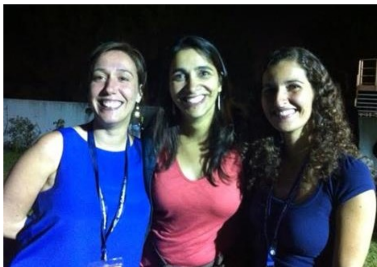
... e o grupo de Comunicação